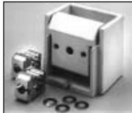
L4.77696.E Lampholder compl. Lampenfassung kpl.