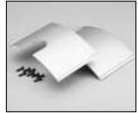
L4.82699.E Bottom baffle extrusion left and right Mantelprofil unten links und rechts