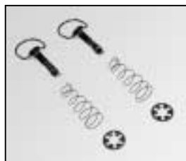
L4.83265.E Fast lock Schnellverschluss