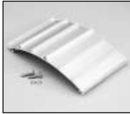
L4.82669.E Bottom extrusion middle Rippenblech unten mitte