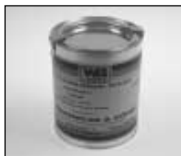
L4.70194.E Paint blue similar RAL 5015 Lack blau ähnlich RAL 5015