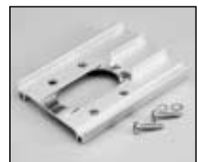
L4.82679.E Bottom extrusion left Rippenblech unten links