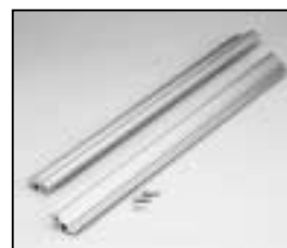
L4.82670.E Insert section left and right Einschubprofil links u. rechts