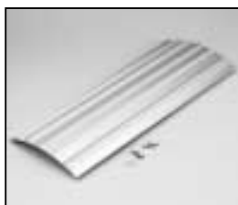
L4.82659.E Extrusion middle Rippenblech mitte