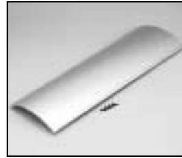
L4.82658.E Main baffle extrusion Mantelprofil