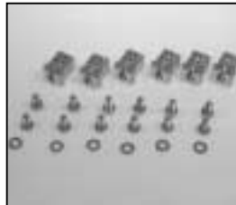
L4.82291.E Set of 6 pcs. lampholder contacts Set mit 6 st. Lampenfassungskontakten