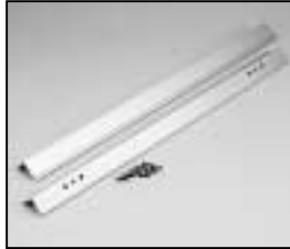
L4.82656.E Reflectorholder Reflektorhalter