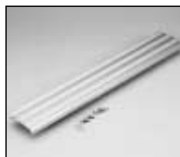
L4.82657.E Side extrusion Rippenblech Seite