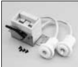
L4.82876.E from ser. no.171 / ab Ser. Nr.171 Thread / Gewinde: 20 mm Lampholder + lampholder support Lampenfassung + Fassungssträger