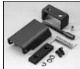
L4.82116.E Top latch compl. Torsicherung kpl.