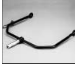
L4.82665.E Stirrup Haltebügel