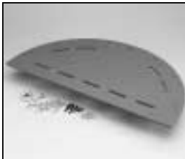
L4.82661.E Cover plate Deckplatte

NOTE: WHEN ORDERING QUOTE PART NUMBER BEMERKUNG: BEI BESTELLUNG IDENT.-NR. ANGEBEN