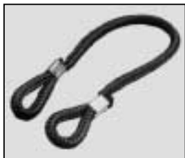
L4.79855.E Cable tie Halteleine