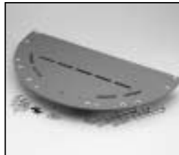
L4.82660.E Bottom plate Bodenplatte