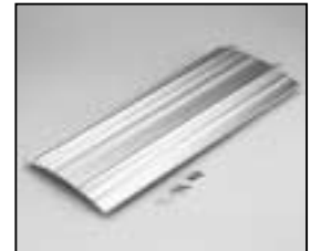
L4.82654.E Extrusion left Rippenblech links