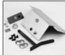
L4.82492.E Lampholder support Fassungssträger