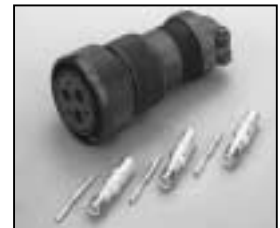
L4.77946.E Veam connector (Female) 16 mm 2 for head to ballast extension cable Veam Stecker (Buchsenkontakt) 16 mm 2 für VG Verlängerungskabel