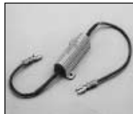
L4.73455.E Compensating resistance for electronic hour counter Vorwiderstand für elektr. Betriebs- stundenzähler