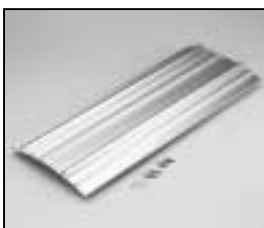
L4.82698.E Extrusion right Rippenblech rechts