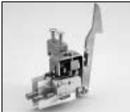
L4.82741.E Safety switch compl. Endschalter kpl.