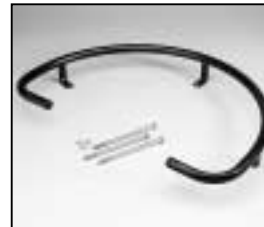
L4.82668.E Base skid Kufe