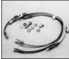
L4.77549.E Connecting wire Verbindungsleitungen