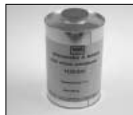
L4.70186.E Paint thinner Farb-Verdünnung