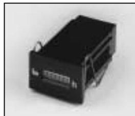
L4.77678.E Hour counter; electronic Betriebsstundenzähler elek.