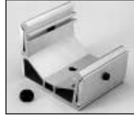
L4.79584.E Stirrup bracket Bügelhalter