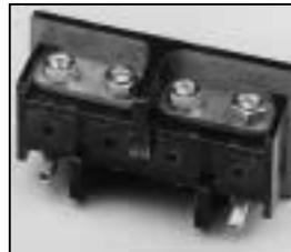
L4.77548.E Spark gap Funkenstrecke