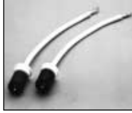
L4.82743.E Thread / Gewinde: 17 mm. H.T. cables cpl. to ser.no.170 Lampen-kabel kpl. bis Ser.Nr.170