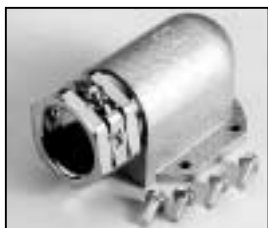
L4.77942.E Screw-type conduit fitting Kabelverschraubung