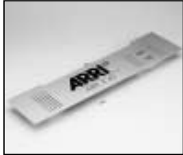
L4.82663.E Front plate Frontplatte