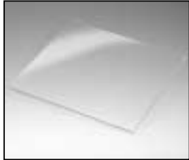
L4.82672XE Protection glass clear for use with L4.82672.E Schutzscheibe klar zum Gebrauch mit L4.82672.E