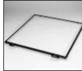
L4.82673.E Frame Rahmen