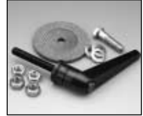
L4.82263.E Stirrup mounting set man. Bügelbefestigungs-Set man.