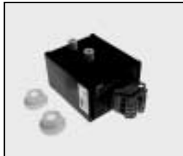
L4.77543.E Ignitor Zündgerät