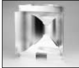
L4.82688.E Reflector Reflektor