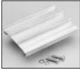
L4.82671.E Bottom extrusion right Rippenblech unten rechts