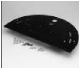
L4.82662.E Intermediate plate Zwischenplatte