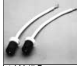
L4.82947.E Thread / Gewinde: 20 mm H.T. cables cpl. from ser.no.171 Lampen-kabel kpl. ab Ser.Nr.171