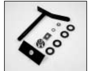
L4.75676.E Lamp lock shaft Hebel geschweißt