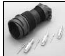
L4.77944.E Veam connector (Male) 16 mm 2 Veam Stecker (Stiftkontakt) 16 mm 2