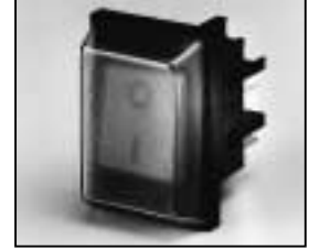
L4.72826.E On/Off switch Wippschalter