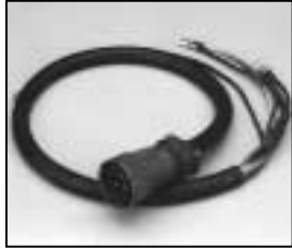
L4.77568.E Mains cable (Veam) Scheinwerferkabel (Veam)